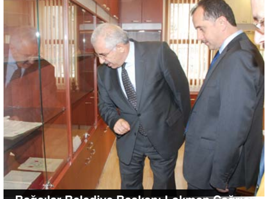
Bağcılar Belediye Başkanı Lokman Çağırıcı