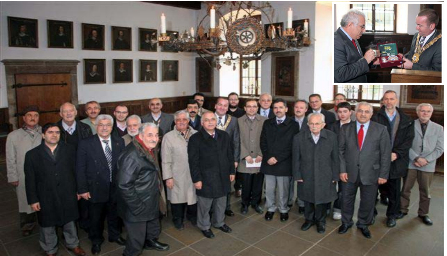
Osnabrück Belediye Başkanı, Sempozyum Organizasyon Heyetini Sarayında Karşıladı