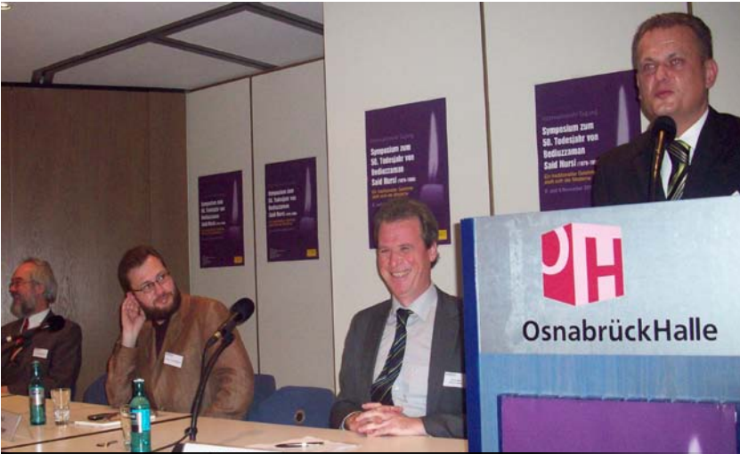
Bosna Herkes, Almanya ve eřitli lkelerden Akademisyenler