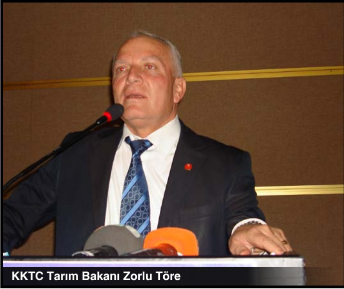
KKTC Tarım Bakanı Zorlu Töre