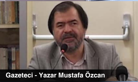
Gazeteci - Yazar Mustafa Özcan