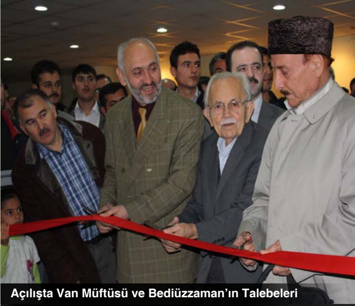
Açılıшта Van Müftüsü ve Bediüzzaman'ın Talebeleri