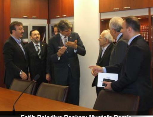
Fatih Belediye Başkanı Mustafa Demir