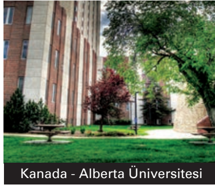
Kanada - Alberta Üniversitesi