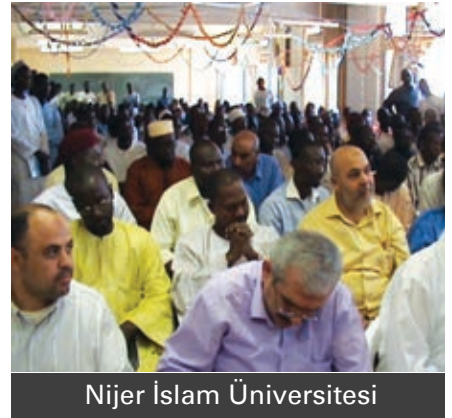
Nijer İslam Üniversitesi

19-21 Mart 2008 tarihlerinde Nijer İslam Üniversitesi, "Bediüzzaman Said Nursi ve Onun İslah Metodu" başlıklı milletler arası bir konferansa ev sahipliği yaptı.