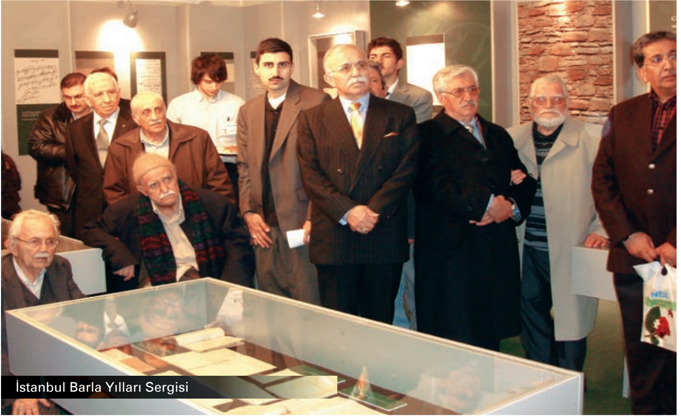
İstanbul Barla Yılları Sergisi

23-30 Mart 2008 tarihlerinde İstanbul'da, Üstad'ın "Barla Yılları"nı mercek altına alan bir sergi düzenlendi.