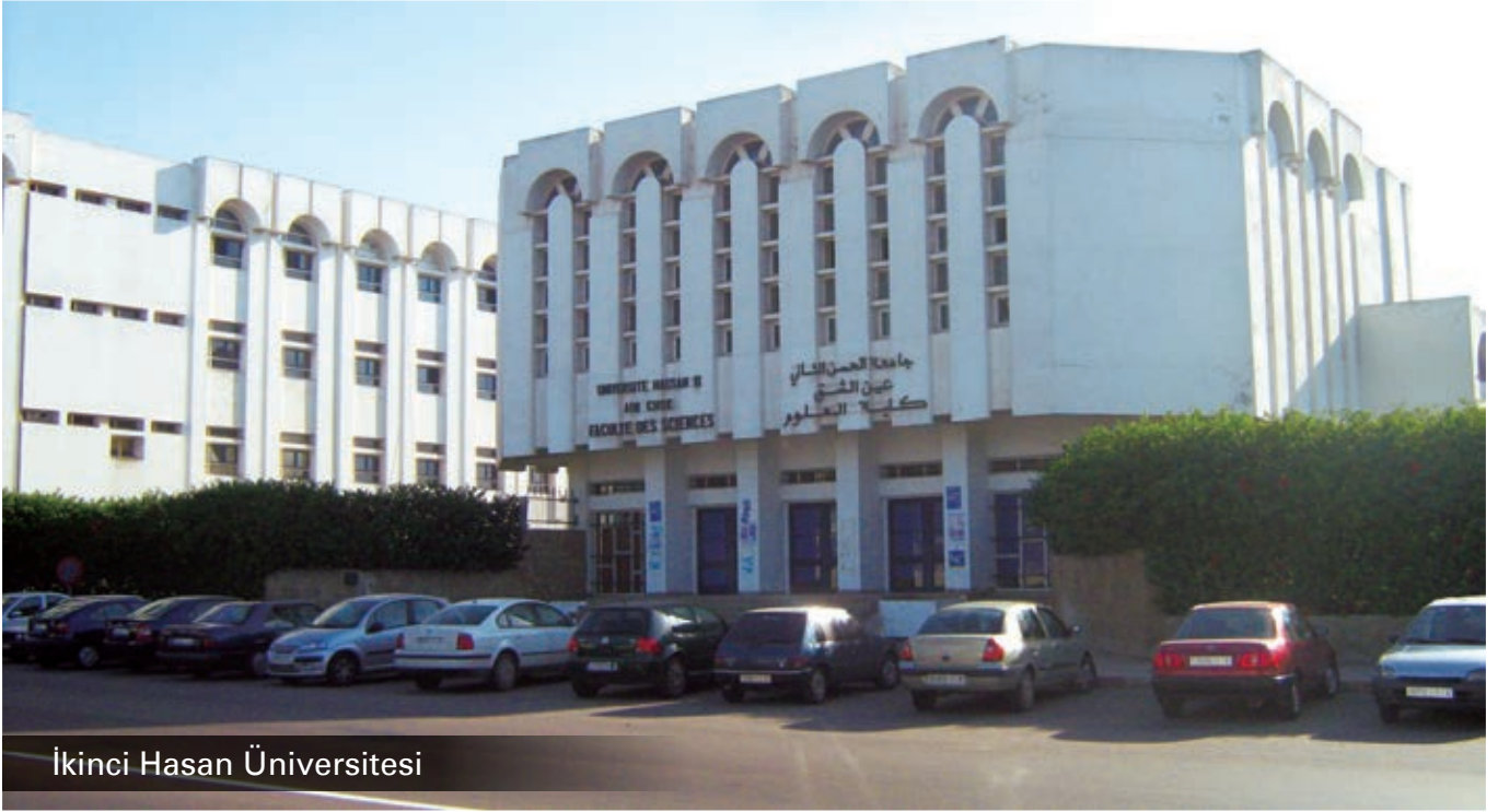
İkinci Hasan Üniversitesi

kış açısı yok. Onun bakış açısında her ikisi de birbirini tefsir eder mahiyettedir” dedi. Özetle şu sonucu ifade etti: “Tefsirlerin bazısı Kur’ân’ı sadece lügavî ilimlere, bazısı sadece şer’î ilimlere, bazısı sadece insanî ilimlere, bazısı da kevnî ilimlere dayanarak tefsir etmişlerdir. Üstad Said Nursî’de ise şunu görmekteyiz: O ilimler Risalelerde tam bir uyum içinde en mükemmel şekilde istihdam edilmiş. O ilimlerin cüz’î nizamından küllî intizâmına ulaşarak Kur’ân’ı anlamaya ve yorumlamaya gidilmiş. Bu sebeple her bir risalede insanlık ve ümran için lâzım olan şümül ve kapsamlılık aksetmiştir. Çünkü Kur’ân, halife-i arz olması hasebiyle câmi bir varlık olan insana hitap etmektedir. Tefsiri de böyle câmi ve kapsamlı olmalıdır.”