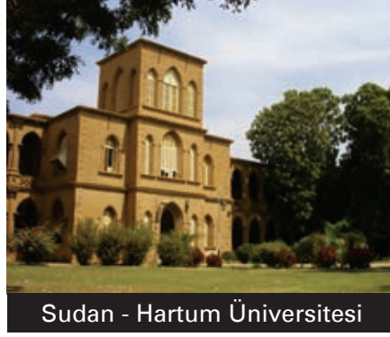
Sudan - Hartum Üniversitesi