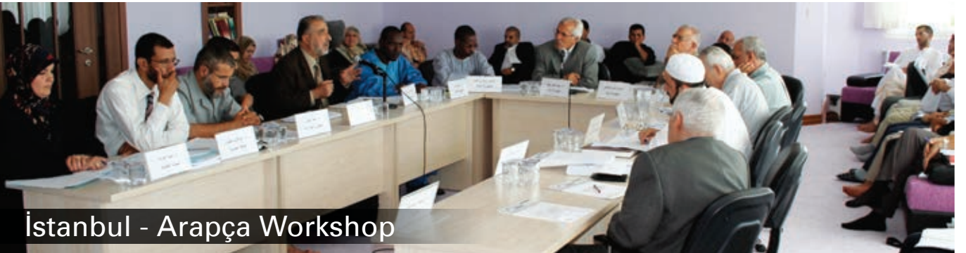
İstanbul - Arapça Workshop