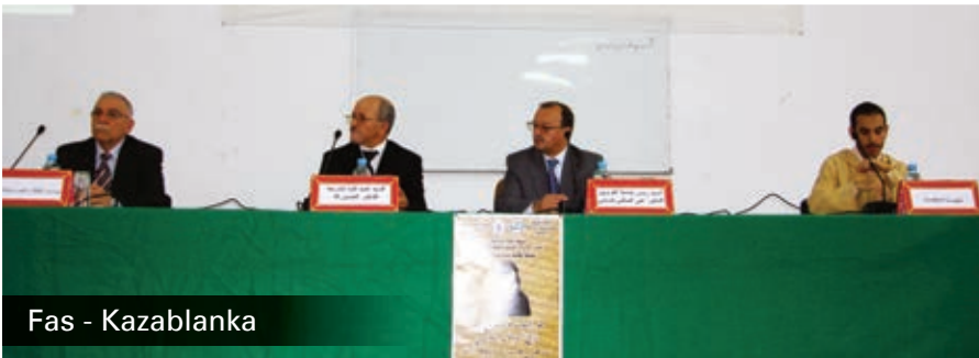
Fas - Kazablanka

SUNY (State University of New York) Press yayınevi tarafından, "Tasavvuf" başlıklı bir kitap yayınlandı.