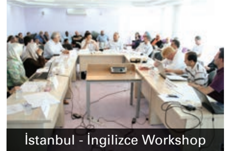
İstanbul - İngilizce Workshop