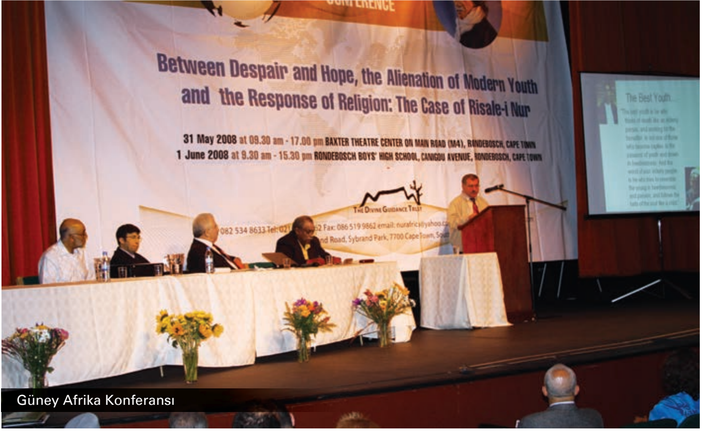
Güney Afrika Konferansı