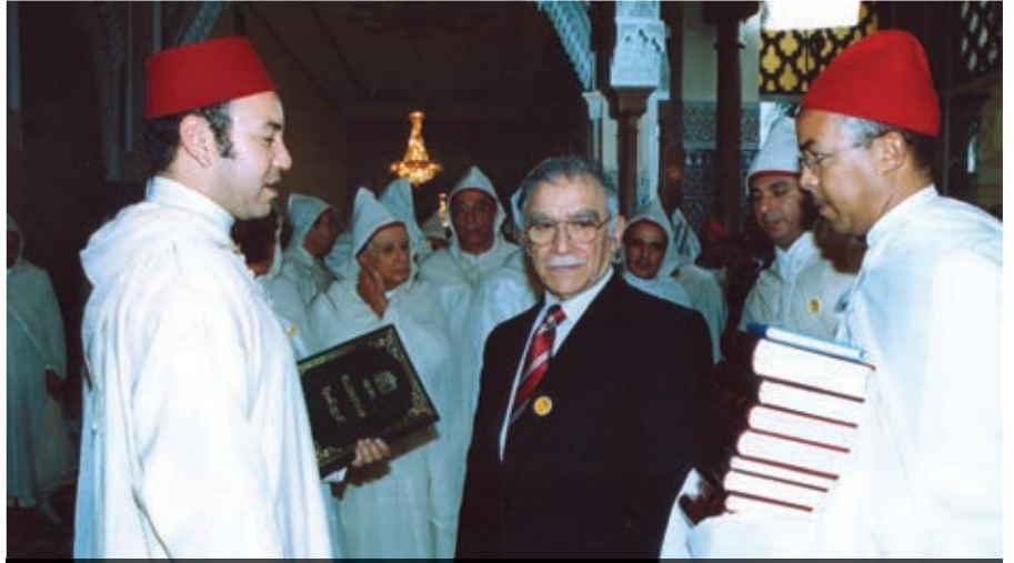
İhsan Kasım Ağabey Fas Kralı 6. Muhammed'e Risale-i Nur Külliyyatı hediye ederken

2000 yılında Vecde'de tertiplenen sempozyumda, Risale-