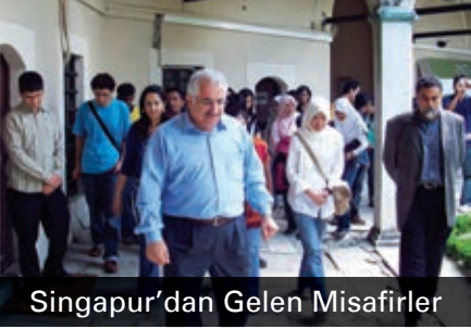
Singapur'dan Gelen Misafirler