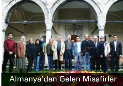
Almanya'dan Gelen Misafirler