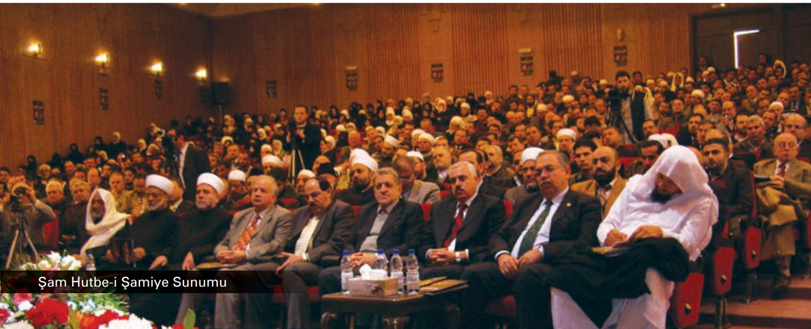
Şam Hutbe-i Şamiye Sunumu