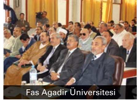
Fas Agadir Üniversitesi

13-14 Mart 2008 tarihlerinde Fas Agadir Üniversitesi'nde, "Kur'ani Maksatlar ve Hikmetleri