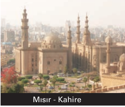
Mısır - Kahire