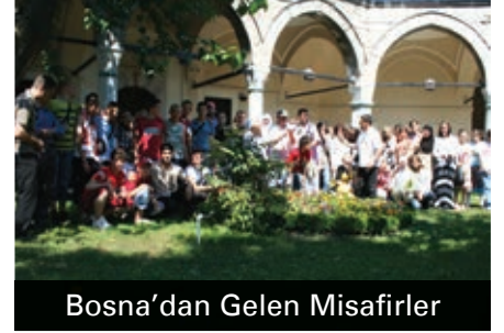
Bosna'dan Gelen Misafirler