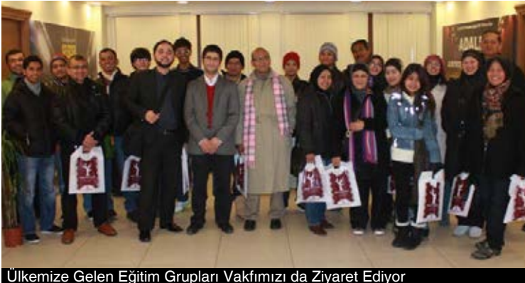
Ülkemize Gelen Eğitim Grupları Vakfımızı da Ziyaret Ediyor