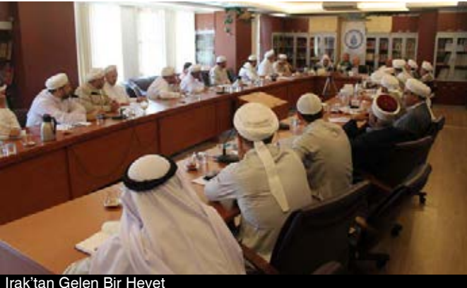
Irak'tan Gelen Bir Heyet