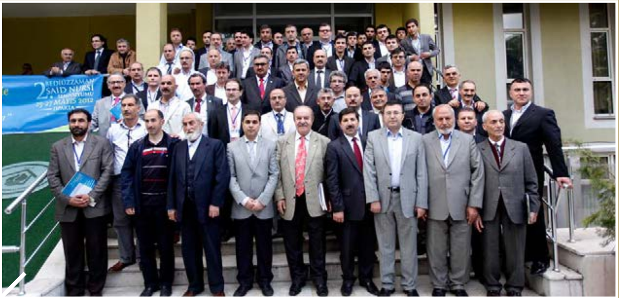
2. Ulusal Bedüzzaman Said Nursi Sempozyumu Isparta'da