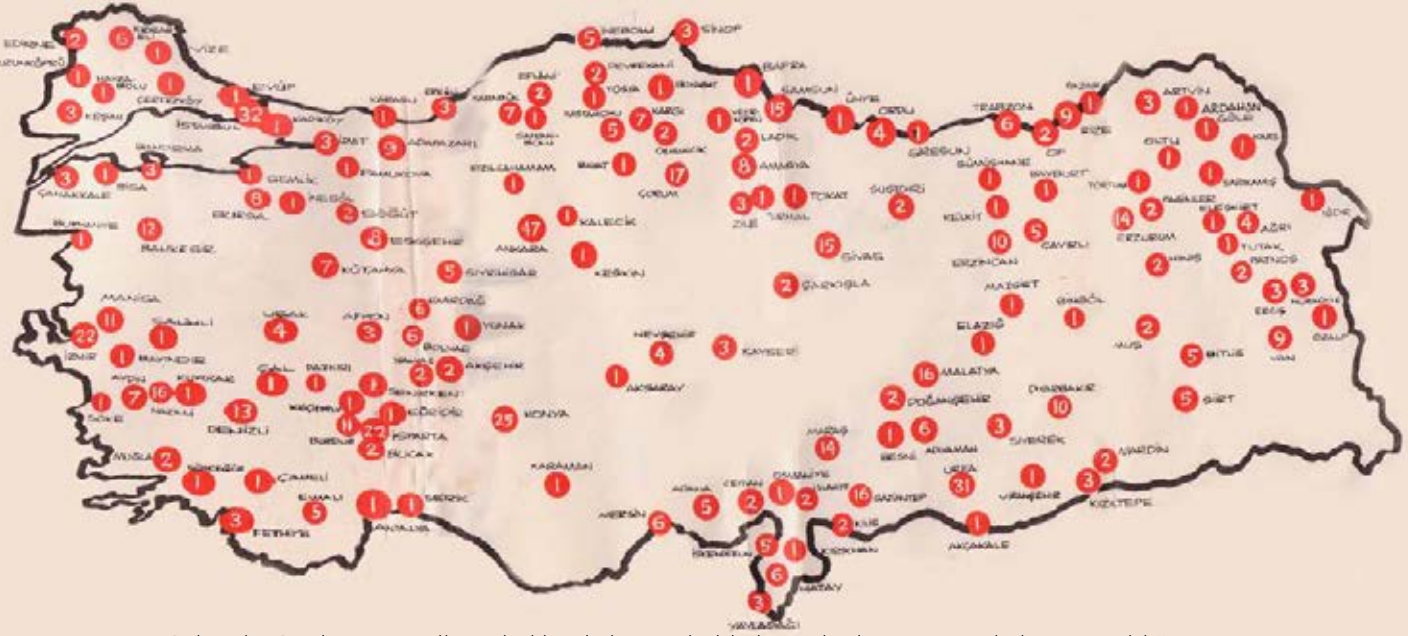
Rakamlar Risale-i Nur Külliyyatı hakkında her mahalde kaç adet beraat ve iade kararı verildiğini gösterir. Risale-i Nur Külliyyatı ile alakalı olarak 11 Nisan 1971 tarihine kadar yurdumuzda maznunların beraati ve Risale-i Nur Külliyyatı'nın iadesiyle neticelenen kesin kararların verildiği yerleri gösteren haritadır.