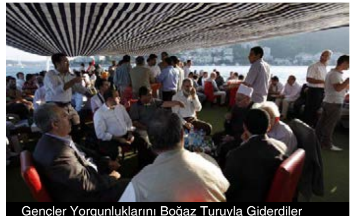
Gençler Yorgunluklarını Boğaz Turuyla Giderdiler