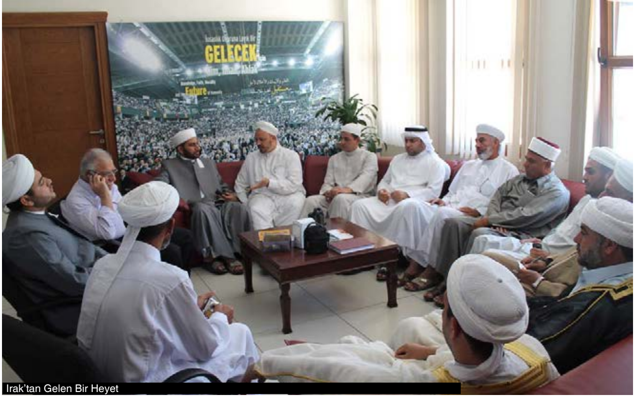
Irak'tan Gelen Bir Heyet