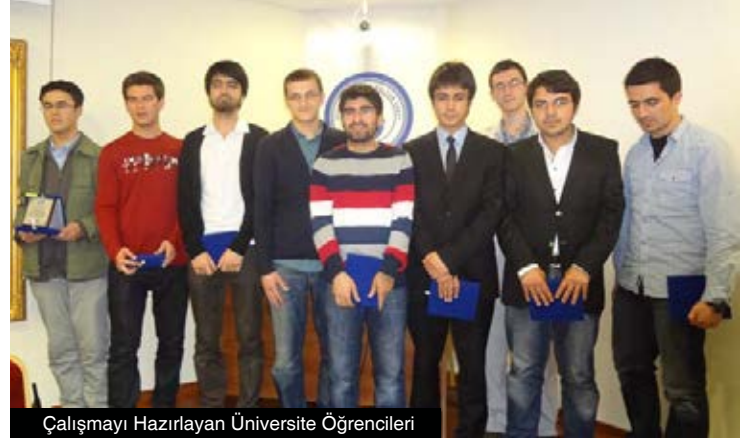
Çalışmayı Hazırlayan Üniversite Öğrencileri

Ülkemizin yeni, sivil ve demokratik bir anayasa yapım sürecine girdiği bu dönemde; Türkiye'de ve dünyada okuyucuları on milyonlara ulaşmış Risale-i Nur Külliyyatı'nın müellifi Bediüzzaman Said Nursi'nin hayatının ilk devresinden beri savunduğu demokrasi, özgürlük ve anayasal düzene ilişkin görüşlerini kamuoyuyla paylaşmanın son derece önemli olduğu kanaatindeyiz. Zira Bediüzzaman'ın savunduğu değerlerin bu ülkenin geleceğine ışık tutabileceğini, özellikle birlik ve beraberliğine büyük katkılar sağlayacağını düşünmekteyiz.