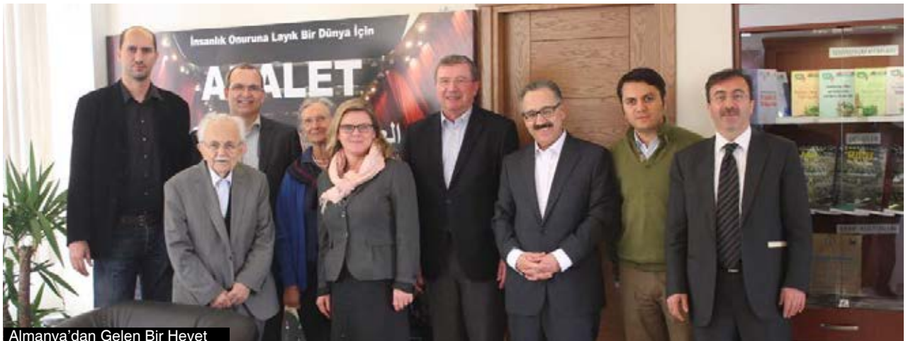
Almanya'dan Gelen Bir Heyet