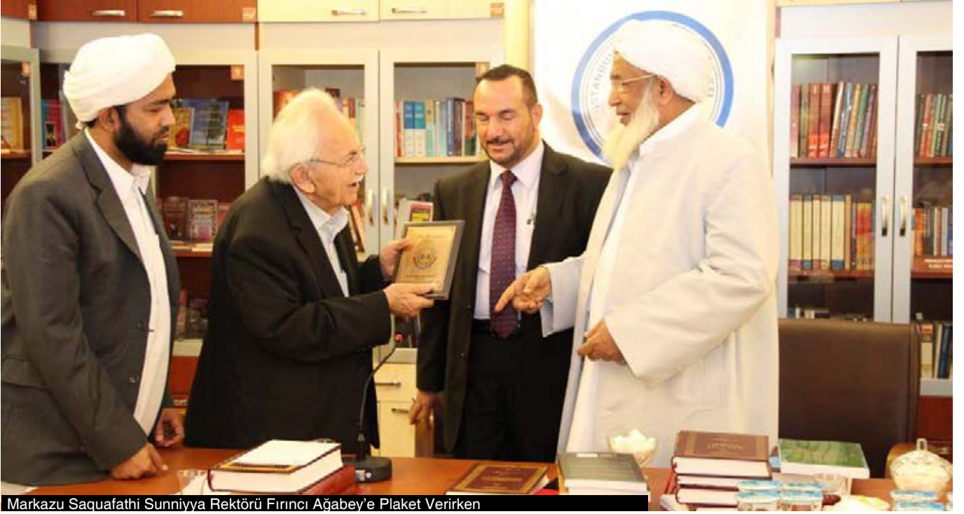
Markazu Saquafathi Sunniyya Rektörü Fırıncı Ağabey'e Plaket Verirken