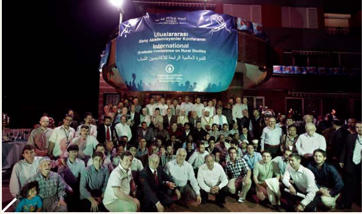
Risale-i Nur Dünya Üniversitelerinde Tez Konusu